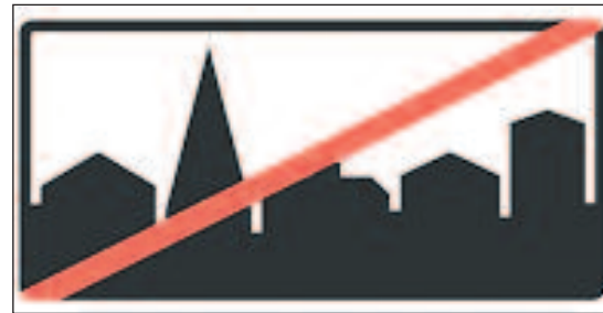
Tätbebyggt område upphör.