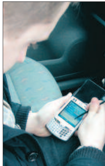
PDA har större bildskärm och inbyggd GPS.

För att PDA:n automatiskt ska kunna stega fram adressuppgifterna krävs hjälp av positioneringssystemet GPS i kombination med koordinatuppgifter för varje postlåda. Framtagandet av koordinater sker i samarbete med TAB:s ägare Posten.