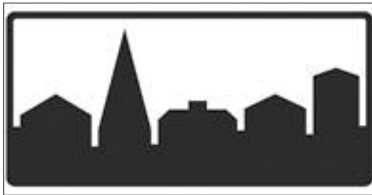
Tätbebyggt område börjar.