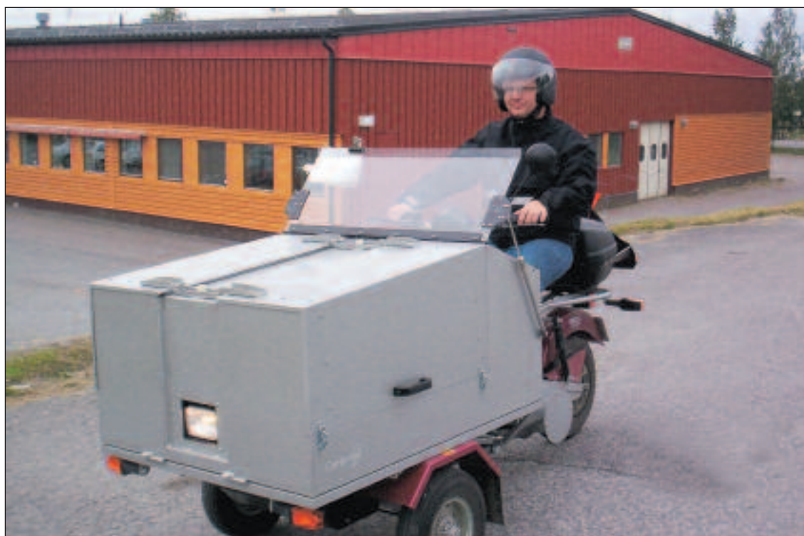
Elmopeden testas i Karlstad och Luleå.