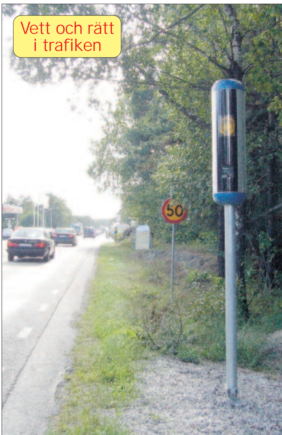
Fartkamerorna sover aldrig

Vägverkets satsning på trafiksäkerhetskameror fortsätter under 2008. Det är inte så konstigt! Vägverket har noterat att medelhastigheten har sänkts med åtta procent på de vägsträckor som fått fartkameror. Risken för allvarliga trafikolyckor har där minskat högst väsentligt. Dels genom kortare stoppträckor, dels genom att – om olyckan i alla fall är framme – personskadorna blivit färre och inte så svåra.