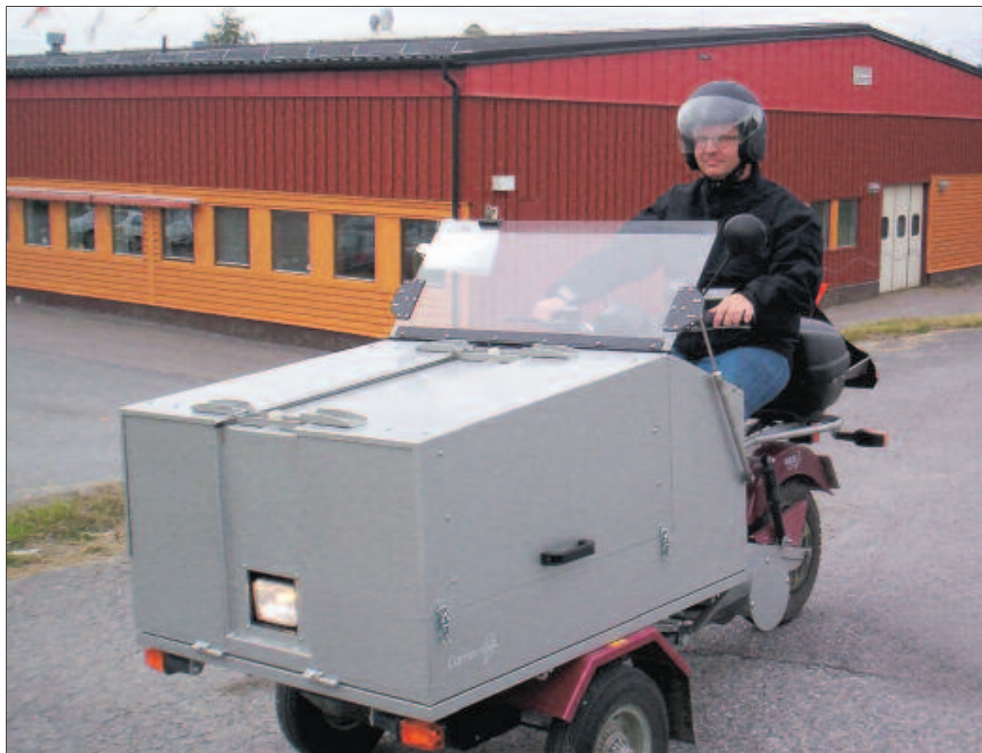
Elmopeden har en finess – den kan backa.