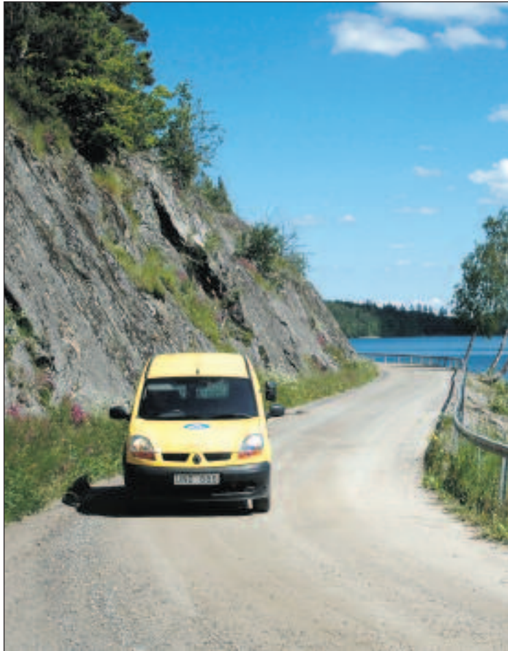
TAB fick bra betyg i årets personalenkät men alldeles för få medarbetare svarade.

pektive region, samt på respektive ansvarsområde, och man kan då se hur TAB uppfattas som arbetsgivare på olika orter och områden. Om svarsfrekvensen inom ett ansvarsområde är för låg får vi tyvärr inte fram något resultat för det området. Och utan resultat är det svårt att veta vad vi ska förbättra i området!