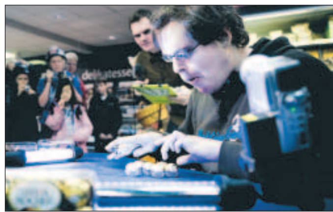
Magnus i total koncentration inför sitt rekordförsök.

På plats fanns representant er för rekordboken, samt två vittnen, samt en liten publik och Dalarnas Tidningars utsände reporter.