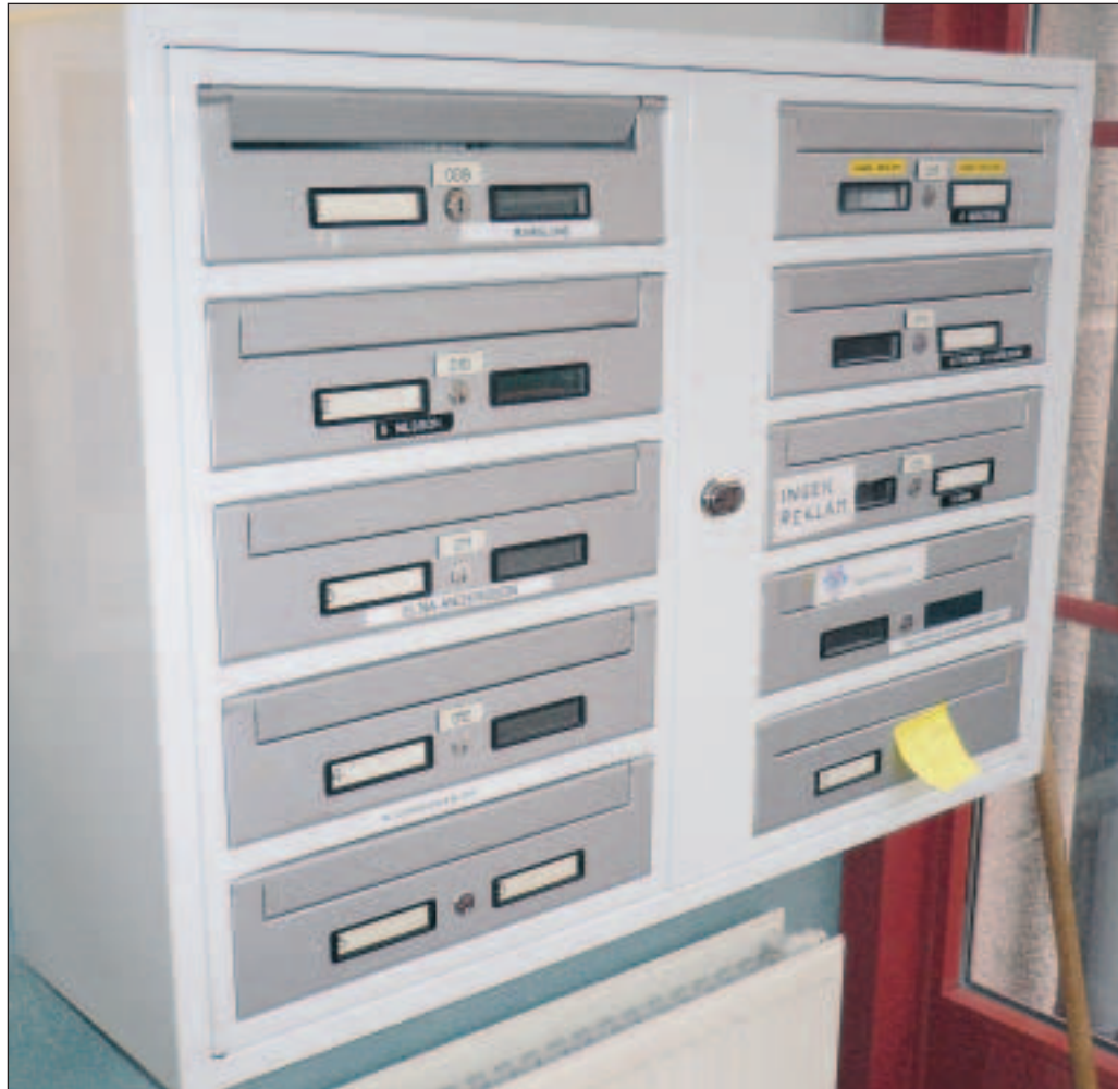
I många nybyggda hyreshus finns numera fastighetsboxar för post. Men två miljoner saknar boxar när regeringen tar bort kravet på installation.

Tanken är att respektive transportör gör sin gradering på den 7-gradiga skalan och att man därigenom visar hur man ligger till inom respektive kravområde. Poängskalan och frågeställningarna är tydliga och lika för samtliga transportörer. Köparen av transporten kan sedan utvärdera respektive transportörs offert, inkl hur transportören uppfyller de olika fastställda kravområdena.