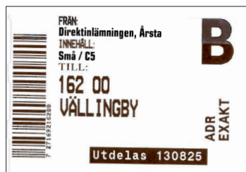
Exempel på lådetikett ADR Exakt